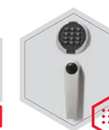
zamek elektroniczny Primor 3000 level 5