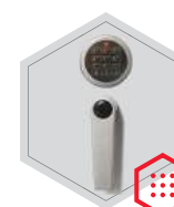
zamek elektroniczny Stellar Basic