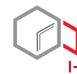
Drzwi dwuściankowe o grubości 72 mm