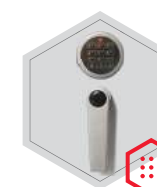
zamek elektroniczny Stellar Business