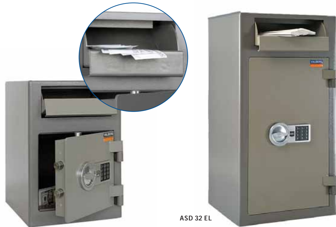
ASD 19 EL